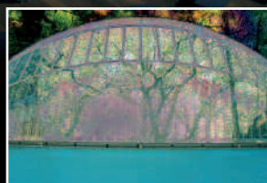
Reportaje Energía y cambio climático