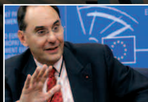
Entrevista Alejo Vidal-Quadras Europarlamentario