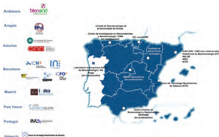
– Figura 3. Distribución geográfica de los centros emergentes de nanotecnología.

Estas estrategias de generación y transferencia de conocimiento se refuerzan con otras actividades complementarias, que tienen como objetivo tanto la internacionalización de nuestros resultados científico-tecnológicos como la divulgación científica. Como ejemplo de la internac-