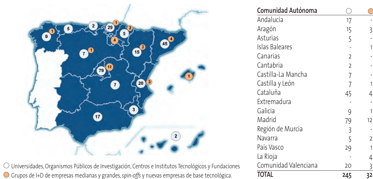
Figura 2. Distribución geográfica de los 277 grupos que en la actualidad son miembros de la Red NanoSpain. La tabla muestra la procedencia de estos grupos diferenciando entre centros de investigación públicos o sin ánimo de lucro y empresas.

2010-2020: ¿La década del despegue de la nanotecnología española?