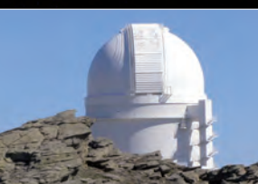
Reportaje Iniciativa Starlight La luz de las estrellas

Especial monográfico: Contaminación lumínica y eficiencia energética ➔