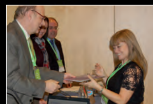
Red de Innovación y Excelencia Profesional en Ciencias y Tecnologías Físicas